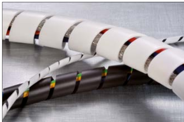
Węże spiralne SBPEFR są dostępne w szerokim zakresie średnic, w kolorach czarnym i białym.